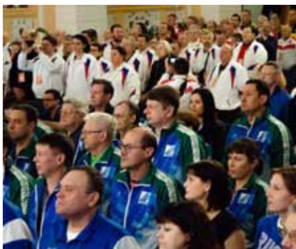
XI Всероссийская Спартакиада «Здоровье» среди профессорско-преподавательского состава и сотрудников вузов Минсельхоза России (4–7 февраля 2020).