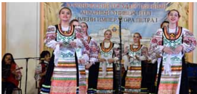
56 лет нашей неповторимой «Чернозёмочке»! (декабрь 2020)