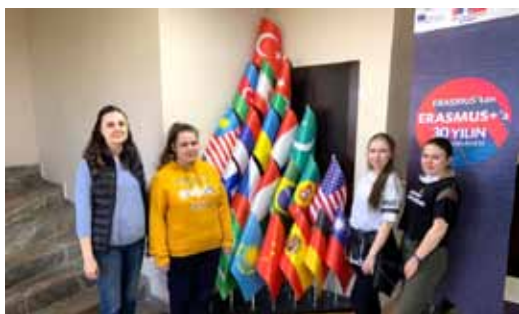
Успешное завершение обучения за рубежом. Сентябрь 2020