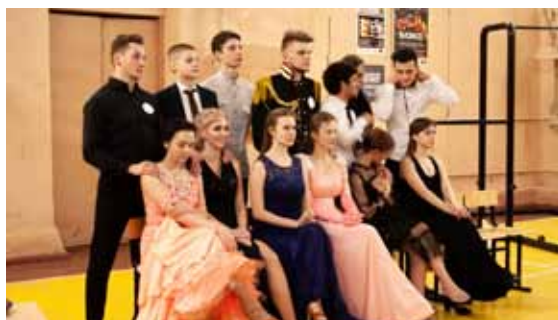
«А ну-ка, парни — апрель 2020»