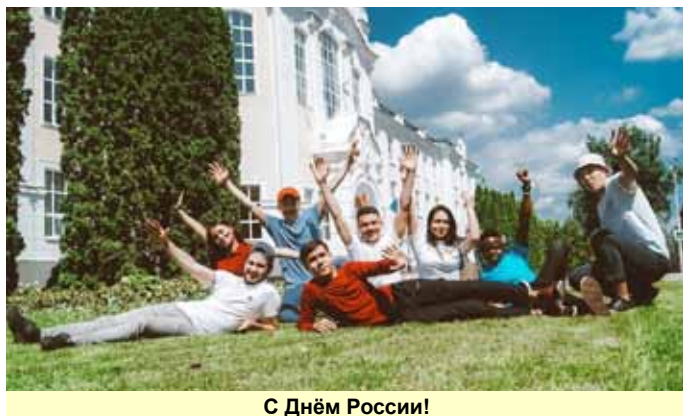
С Днём России!