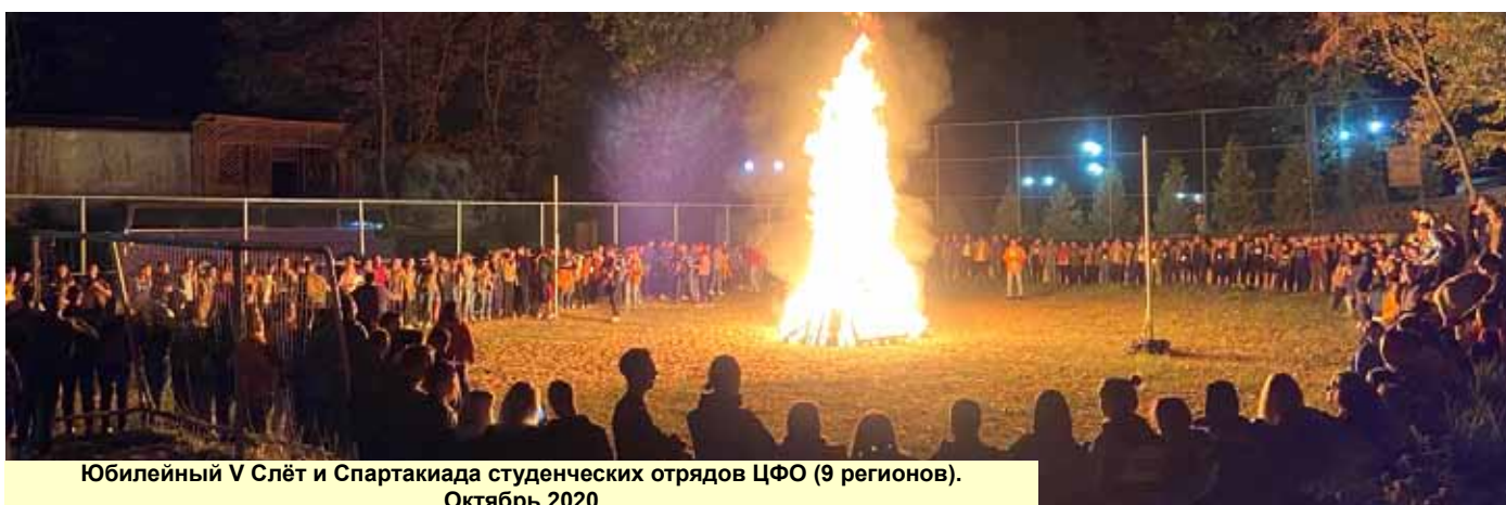
Юбилейный V Слёт и Спартакиада студенческих отрядов ЦФО (9 регионов). Октябрь 2020