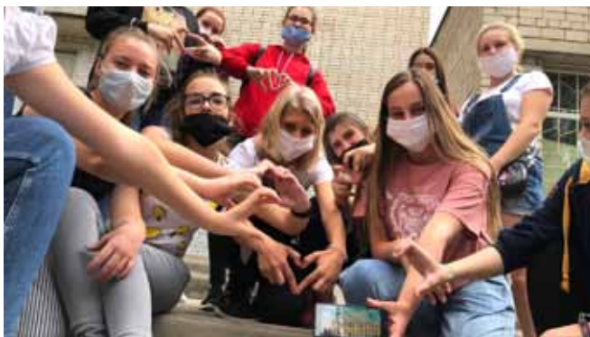
Квест «Начало» состоялся: счастливого пути тебе, первокурсник Сентябрь 2020