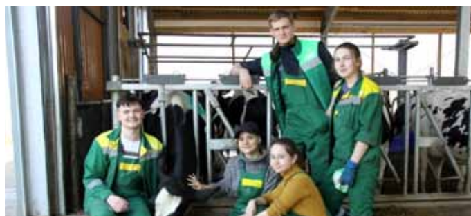
Студенческие отряды ВГАУ открыли трудовой семестр! Июнь 2020