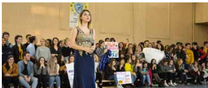
«А ну-ка, девушки — апрель 2020»