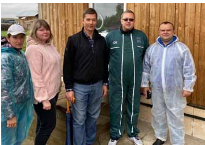
Наши представители на Всероссийском сельскохозяйствен- ном семинаре Союза органического земледелия России – «Органическое молочное животноводство». Октябрь 2020