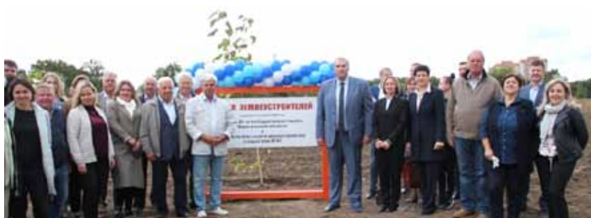
Взрастай, «Аллея землеустроителей»! Сентябрь 2020