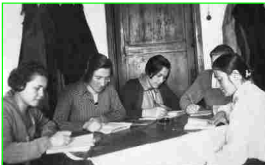
Январь 1935 года. 19 комната общежития Сельскохозяйственного института за образцовую чистоту была премирована фотографией.