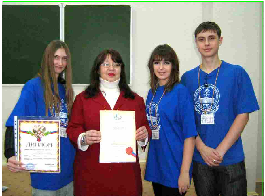
Материалы полосы подготовила Е.И. Шомина, помощник проректора по науке

описав в качестве примера свою учебную группу и процитировав по этому поводу преподавателя химии. Конечно это было отмечено как приведённые к месту примеры и творческое отношение к делу. Все без исключения члены жюри выделили эту работу как лучшую. Остальные участники нашей команды тоже выступили хорошо и в итоге в командном зачёте наши ребята заняли 3 место. Поздравляем победителей со столь значительным достижением.