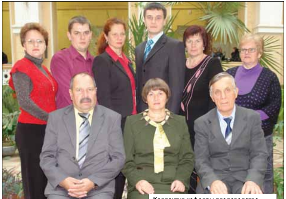
Коллектив кафедры плодового и овощеводства

На агрономическом, агрохимическом, технологическом, экономическом, землеустроительном факультетах сотрудниками кафедры преподаются более 20 дисциплин: «Плодоводство», «Овощеводство», «Виноградарство», «Овощеводство защищенного грунта», «Питомниководство», «Декоративное садоводство», «Селекция плодовых и